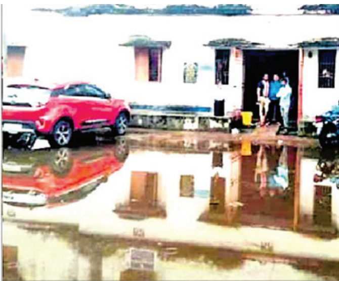
ପାଣିର ସୁଅ ହୁଏ । ପାଣି ଜମିରହି ପୂର୍ତିଗଣମଧ୍ୟ ପରିବେଶ ଦୂଷିତ ହେଉଛି ।

ପଟ୍ଟାମୁଣ୍ଡା (ଅନୁତ ମିଡିଆ): ଲୟତାପଜନିତ ଲଗାଣ ବର୍ଷାରେ କେନ୍ଦ୍ରାପଡା ଜିଲ୍ଲା ପଟ୍ଟାମୁଣ୍ଡା ଅଞ୍ଚଳରେ ବ୍ୟାପକ କ୍ଷତି ହେବା ସହ ଜନଜୀବନ ଅସ୍ତବ୍ୟସ୍ତ ହୋଇପଡିଛି । ବିଶେଷକରି ମୂର୍ଚ୍ଛିଳା ଲାଗି ତେଲକୂଣ୍ଡ ସଂସ୍କାର ତଳାଡ଼ିଆରୁ ଅଥବା ଲୋକର ହାଣ୍ଡି ଉପରେ ଲଗାଣ ବର୍ଷା ଏକପ୍ରକାର ଦାଢ ବାହୁଛି । ଗତ ୫ ଦିନ ଧରି ବର୍ଷା ଲାଗି ରହିଥିଲେ ମଧ୍ୟ ଗୁରୁବାର ରାତିରୁ ବର୍ଷା ପରିମାଣ ବଦଳିଯାଇଛି । ଗଣକମି ଜନମଣ୍ଡଳ, ରାଷ୍ଟ୍ରାୟତରେ ବର୍ଷାପାଣି ଜମିରହିବା ଫଳରେ ରାଷ୍ଟ୍ରାୟ ପ୍ରକୃତ ସ୍ଥିତି ଜଣା ନ ବଢିବାରୁ ଦୁର୍ଗତଗଣ ଯତୁଛି । ଏଥିସହ ଜଳ ନିଷ୍ପାଦନ ପଥ ନ ଥିବାରୁ ପଟ୍ଟାମୁଣ୍ଡା ଉପଖଣ୍ଡରୀୟ ଚିକିତ୍ସାଳୟର ଷ୍ଟାର୍ଟ୍ କାର୍ଯ୍ୟ ସ୍ଥିତି ପାଣିଘେରରେ ରହିଛି ।